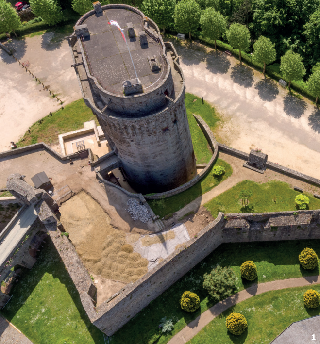
1. Alterado a finales del siglo XVI, el castillo de Dinan se convirtió en una fortaleza.