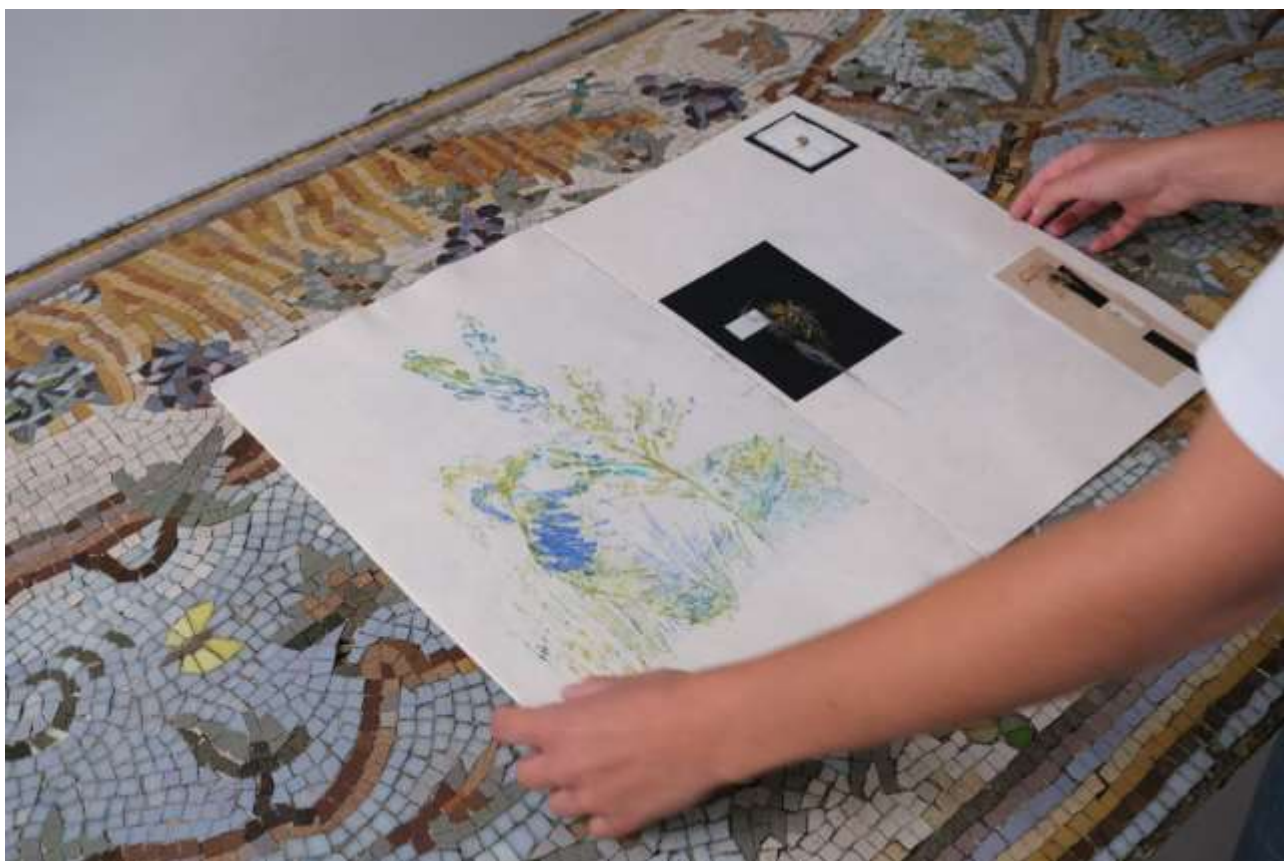
Vétuste, installation composée d'une édition unique, « Férale », 44,5 x 29,7 cm, présentée sur table en mosaïque L 198 x l 91 x H 80 cm, 2023