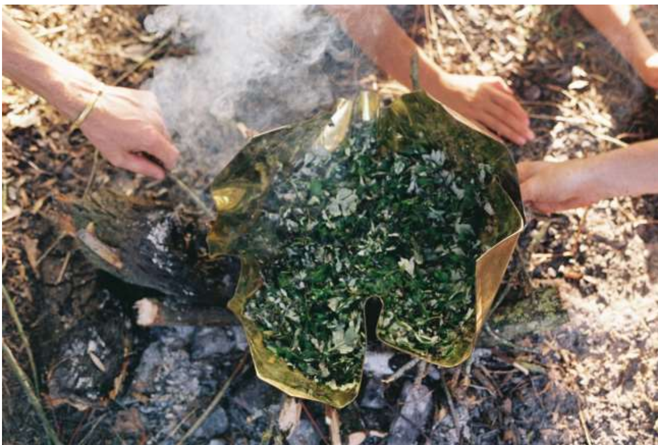
Workoff III, bivouac créatif et teinture locale. Du récipient à la plante, 2023.