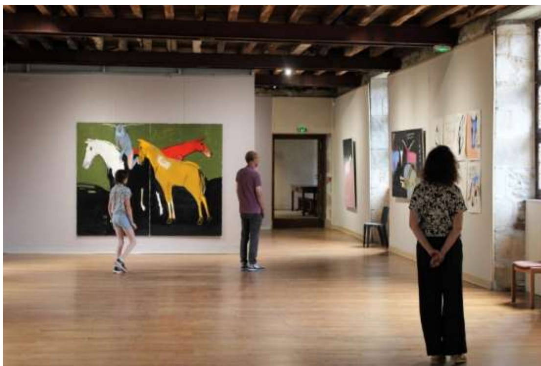
@B.Bachelier - 2023