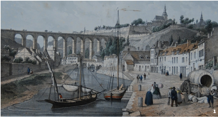
1. Vue du viaduc prise du quai, lithographie, 1853-1857, n°inv. 1956.20.02. Musée de Dinan.