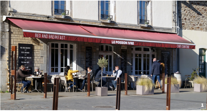
1. 2. Rue du Quai, Dinan.

Dans les Sites Patrimoniaux Remarquables (SPR), l'ABF veille à la cohérence des dispositions inscrites au plan de sauvegarde (la loi Malraux de 1962 visant à prévenir la destruction des centres anciens) lors de son élaboration et de sa révision, puis à leur respect lors des travaux intérieurs et extérieurs (article L631-3 du Code du Patrimoine).