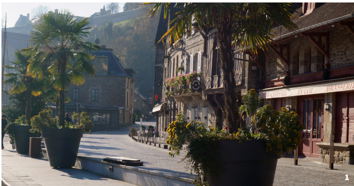
1. Rue du Quai, Dinan.