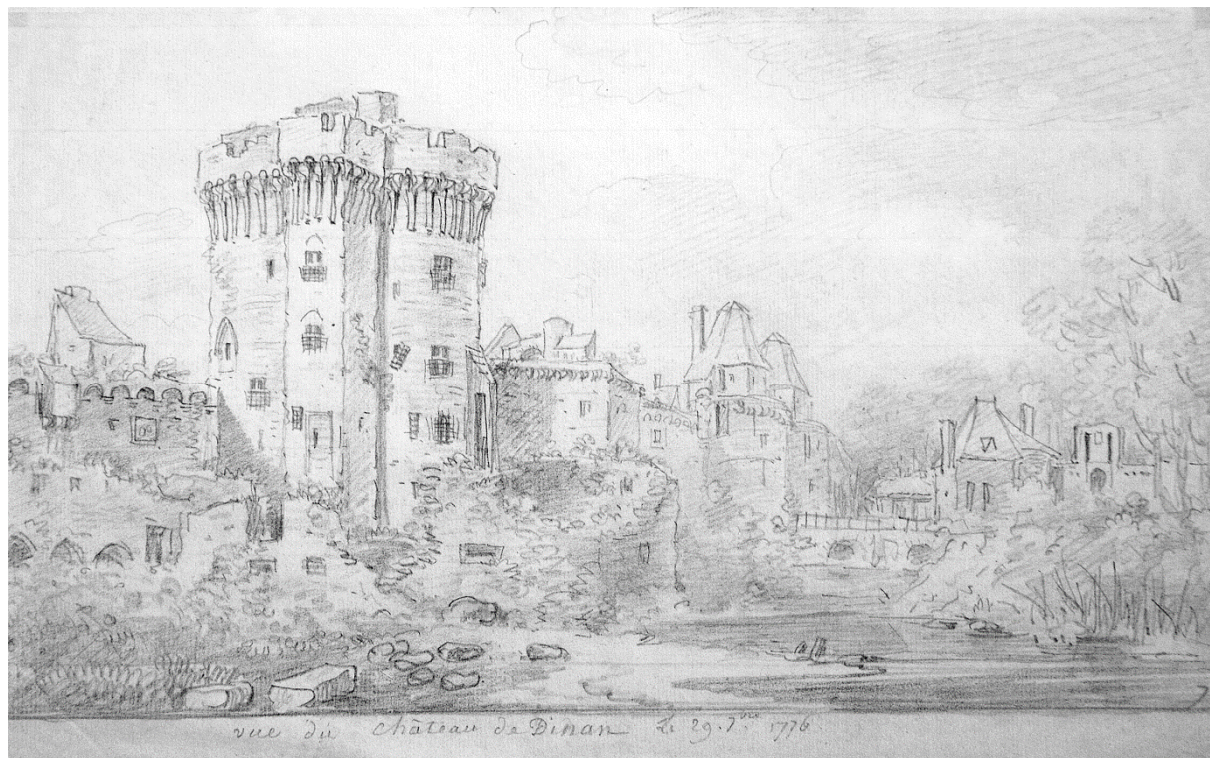
Vue du château de Dinan - Louis-François CASSAS - Inv.1982.01.37

A compter de la fin du 18 ème siècle, les peintres commencent à s'intéresser à la Bretagne. Il existait, bien sûr, des représentations de paysages de la province bretonne bien antérieures, mais elles étaient assez peu nombreuses. La fin du siècle des Lumières voit naître un nouvel éveil des peintres voyageurs. Le Musée de Dinan peut témoigner de cette nouvelle impulsion par un dessin de Louis-François CASSAS, représentant le château de Dinan.